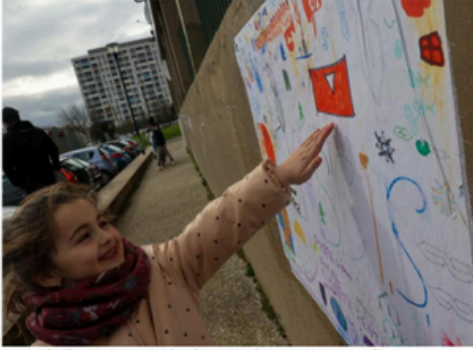
Un grand collage était organisé dans le quartier de Borny, à Metz, samedi.

Des messages en tous genres Les messages exprimés par les artistes sont variés.